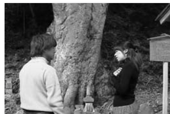
2009年度最優秀賞「20年目のプロポーズ」 (制作:松谷琢也)

聴覚障害者や聴覚障害者を含むグループ等が、監督、キャスター、カメラマン、出演者として制作、応募した映像作品を発表いたします。